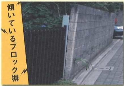
傾いているブロック塀