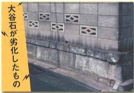
大谷石が劣化したもの