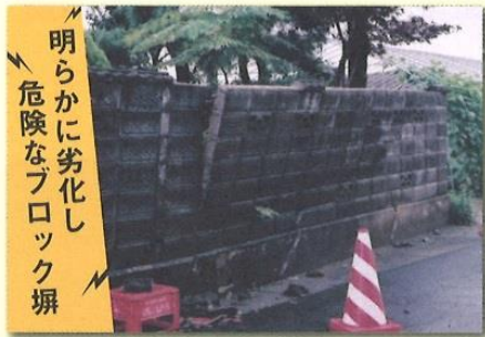
明らかに劣化し危険なブロック塀