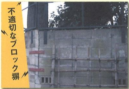
不適切なブロック塀

こんな症状があると、震災時に転倒や倒壊の恐れがあります。人が死傷したり、救急活動・物資供給の妨げになります。専門家に相談の上、早めの対策をしましょう。